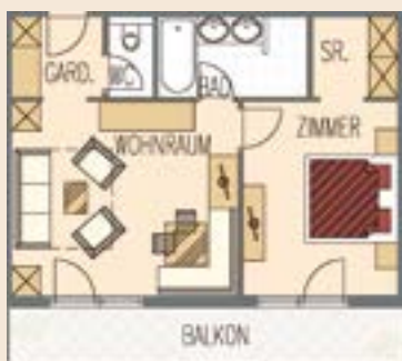
BERGKRISTALL, SMARAGD ROSENQUARZ, GRANAT